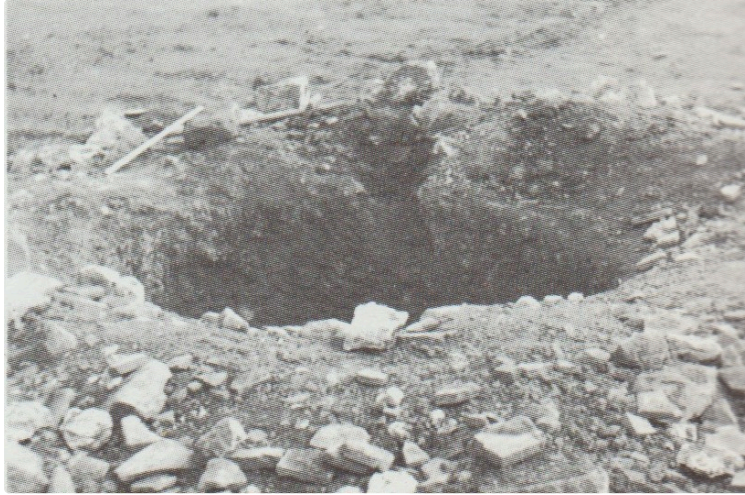
"Revenons sur nos pas" : découverte d'un four tuilier sur le plateau sportif

Comme tous les dimanches, nous retrouvons notre rubrique "Revenons sur nos pas".