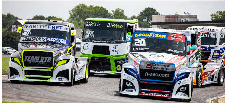
Les courses de camions à Nogaro : Grand Prix Camion (II)

Téo Calvet sur son Buggyra domine la compétition