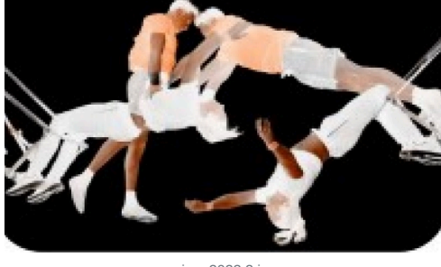
circa 2023 2.jpg