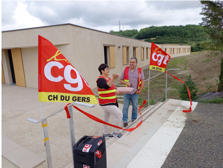
Inauguration symbolique par la CGT de la nouvelle Maison d'accueil spécialisée (MAS)

Après des années de combats la CGT voit le bout du tunnel avec la reconstruction d'une nouvelle MAS