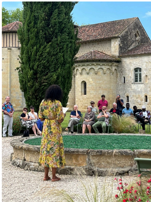
Dans les jardins de l'Abbaye de Flaran.

Bien sûr, il est toujours dommage que les spectateurs ne se déplacent pas assez pour découvrir ces artistes qui au regard de leur diversité toucheront chacun de nous à un certain moment, forcément. Et ce ne sont pas ceux et celles à qui le Slam se révélait pour la première fois qui diront le contraire car enchantés, ils ont été, repartant le coeur plein de poésie. Valence Ton Slam 2023 est terminé : Vive le Slam et tout le bonheur et les émotions qu'il apporte !