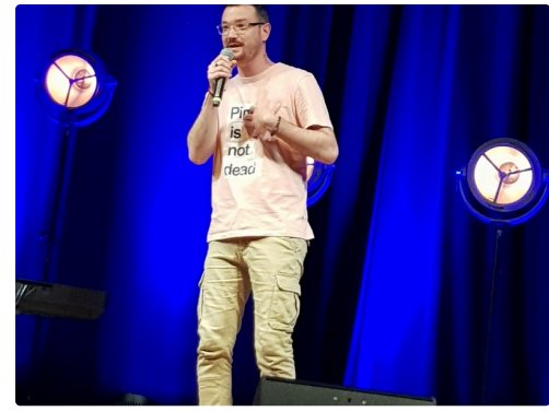
Neimad, un moment de grâce.