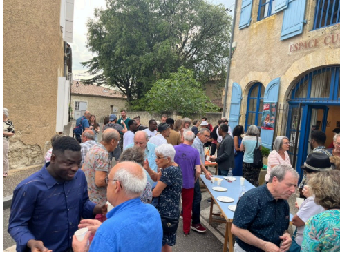
Vernissage de l'expo à l'Espace Culturel.