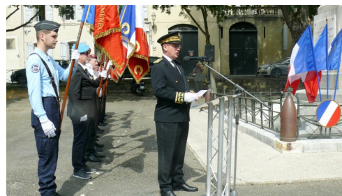
Lecture du message ministériel par le préfet du Gers.