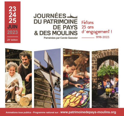
Journées Patrimoine 2023 3.jpg