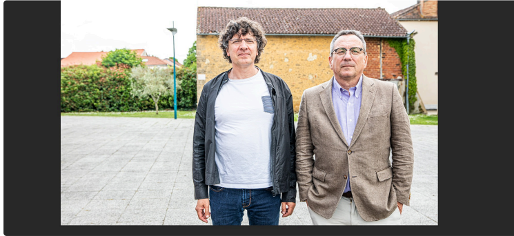
Programme des Rencontres littéraires à Nogaro et ailleurs sur 4 jours