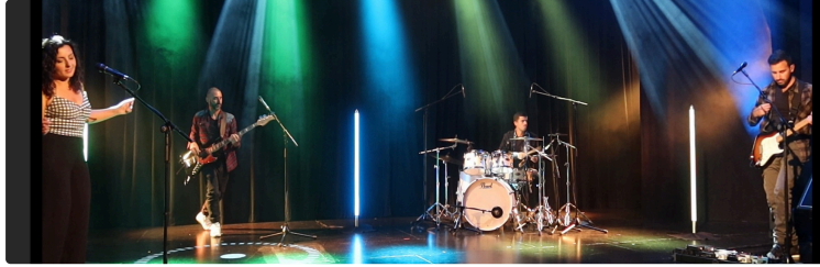
L'hôtel-restaurant Solenca (à Nogaro) lance son été musical et gastronomique