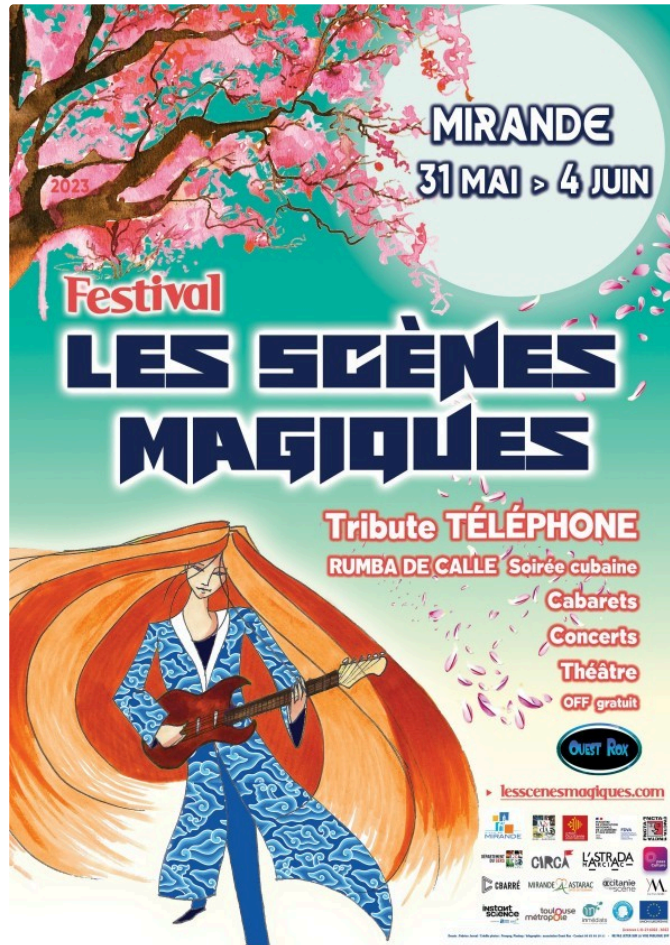
Le Festival Les Scènes Magiques ouvre ses portes

"L'idée est de rendre la culture accessible à tous, que l'argent ne soit pas un frein"