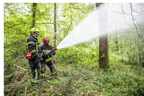
Le chef d'équipe et une équipière s'attaquent au "feu"