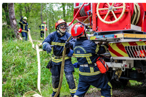
Les équipiers commencent à tirer le tuyau