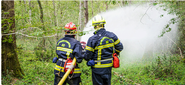
Les sapeurs-pompiers s'entraînent à Aignan contre les feux de forêt

Le SDIS 32 augmente ses moyens humains et matériels dans cette perspective