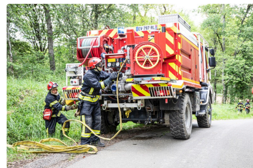
Une équipe déroule le tuyau de son camion-citerne