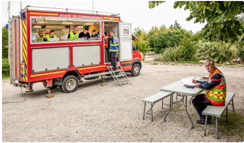
Le camion PC