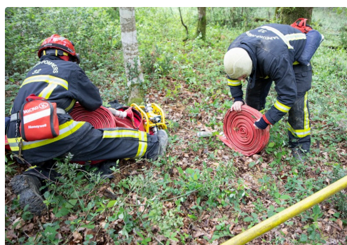
Préparation de rallonges rangées dans la claie de portage