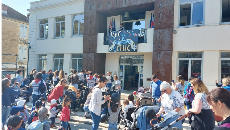
Pentecôtavic 2023 : les tout-petits ouvrent les festivités !

Judi matin, ce sont les tout-petits qui ont lancé les festivités de Pentecôtavic.