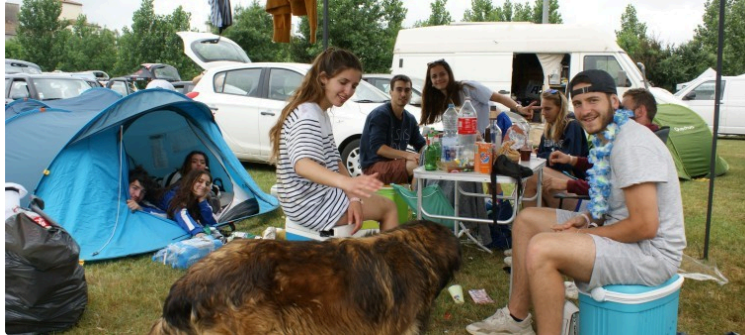
Pentecôtavic 2023 : camping et navettes