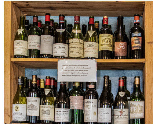
Témoignages de dégustations avec les vignerons d'élite en visite : « c'est bien d'être reconnu par ses pairs ! »