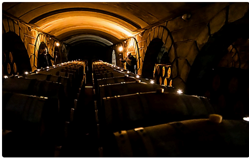
Des voies dans le sanctuaire du vin