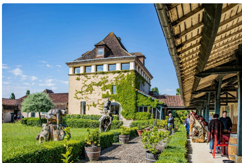
Le château de Bouscassé avec 3 des nombreuses trognes