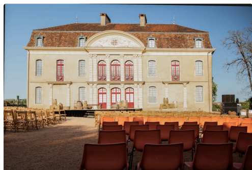
Le château Montus prêt pour la représentation en 2022

N.B. - Sur la photo du haut de page: lors des Nuits impériales de 2022, Bonaparte revient d'Égypte.