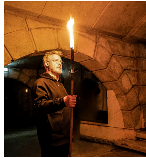
Zeus se rapproche des mortels