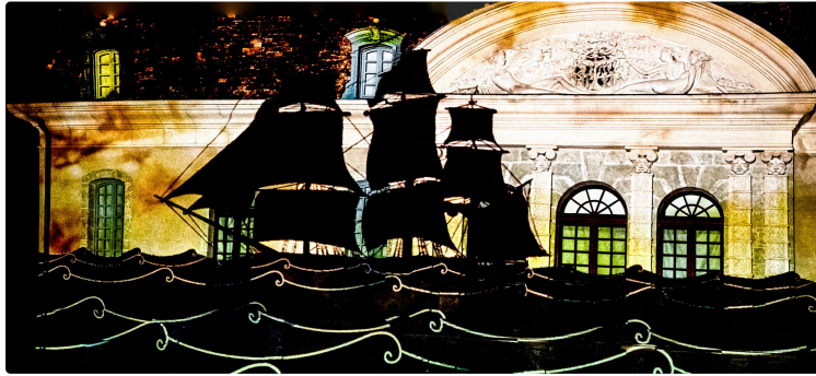
Bientôt 3 Nuits impériales au château Montus

« Une trilogie gagnante : art, vin, gastronomie ! »