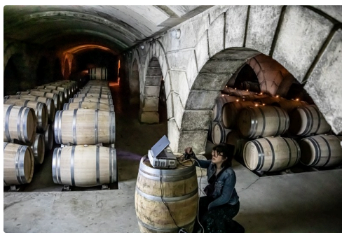
Immersion dans le chai et dans l'Histoire