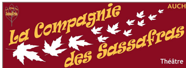
Clap de fin de la saison théâtre des Sassafras

Le samedi 27 mai, la Compagnie auscitaine des Sassafras fêtera la dernière date de sa saison de théâtre amateur.