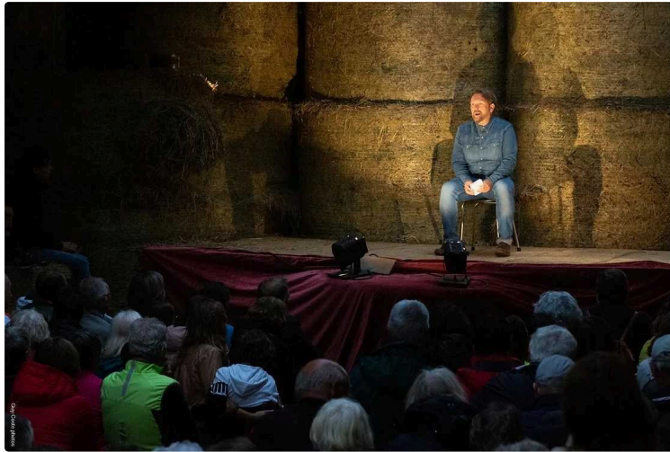
Et zou ! Site § Cap propose "Mon père avait trois vaches" un spectacle inédit joué dans des conditions insolites !