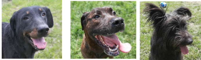
Sky, Baboune et Rony à la une cette semaine

Ils ont 6, 5 et 2 ans, sont arrivés il y a peu au refuge et, même s'ils y sont bien, souhaitent le quitter le plus vite possible pour une gentille famille.