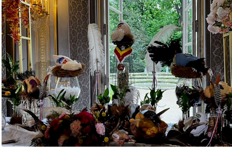
Un Chapon et quel chapon à l'Elysée !