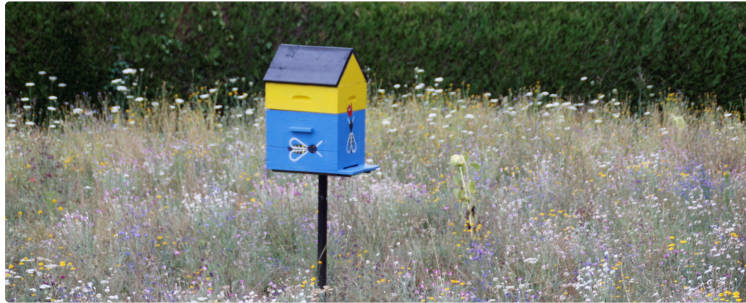
Un choix dans la biodiversité

Les services techniques de la ville de Miélan ont fait un choix en biodiversité pour respecter un espace fleuri.