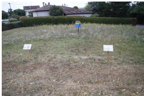
Biodiversite La Tourette 23072022 (2).JPG

Cette réalisation du personnel des espaces verts apporte sa contribution à la candidature de Miélan dans le cadre des villes et villages fleuris du Gers.