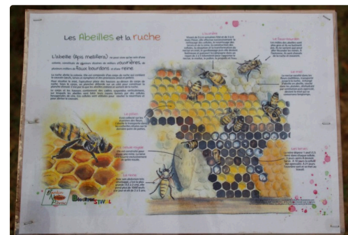
Biodiversite La Tourette 23072022 (5).JPG