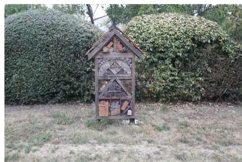
Biodiversite La Tourette 23072022 (9).JPG