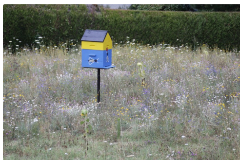
Biodiversite La Tourette 23072022 (12).JPG