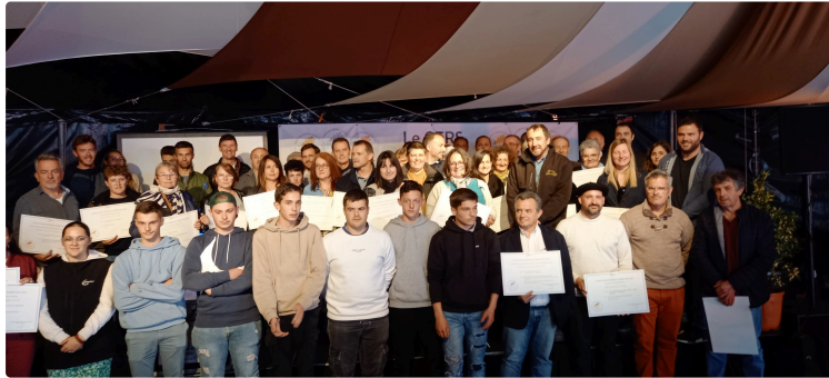
Les lauréats gersois du Concours général agricole mis à l'honneur

Une cérémonie de remise de diplômes initiée par la Chambre d'agriculture pour honorer producteurs et éleveurs