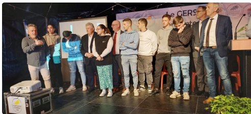
Les élèves et leur professeur du lycée professionnel agricole de Mirande.