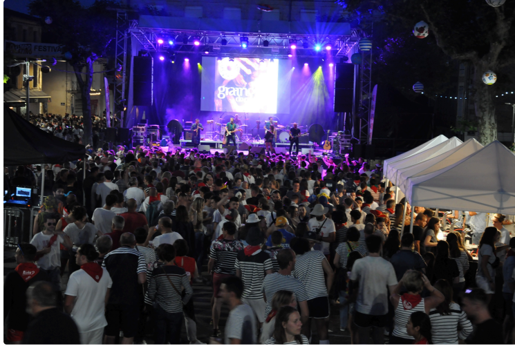
Pentecôtavic 2023 : distribution des bracelets gratuits et des laissez-passer à partir de lundi 15 mai

Dans le cadre des festivités de Pentecôtavic, le périmètre de la fête sera fermé et payant pendant 3 jours.