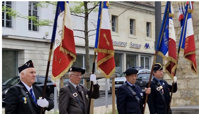
Cérémonie en hommage aux victimes et héros de la déportation.