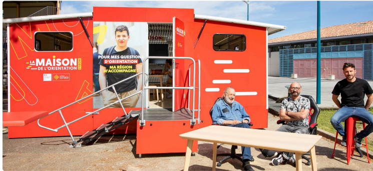
La MOM (Maison d'orientation mobile) de la Région en visité éclair à Nogaro

C'est une réalisation intéressante de la Région Occitanie : les Maisons de l'orientation de Toulouse et de Montpellier disposent de deux Maisons de l'Orientation mobiles (MOM), destinées à venir au devant des jeunes qui s'interrogent sur la voie à prendre, des personnes en recherche d'emploi et des salariés en reconversion.