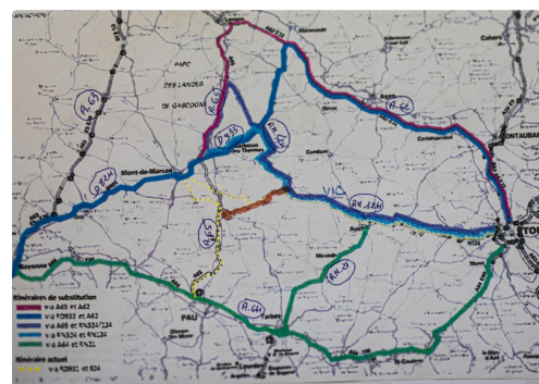
Itinéraires actuels et itinéraires de substitution