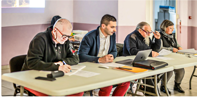
2022, année bien remplie pour les Amis du Castet de Sainte-Christie-d'Armagnac Et une année 2023 avec des projets, mais peu de bénévoles...