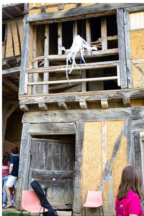
Fantôme au balcon (Fête des Arts)