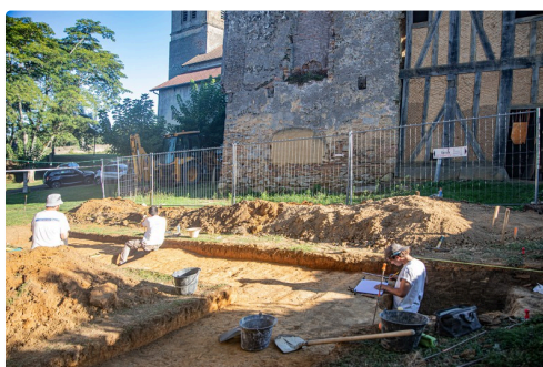
Vue des fouilles en 2020