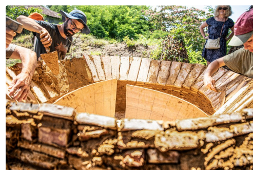
Le four en cours de reconstruction