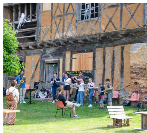
La Fête des Arts commence