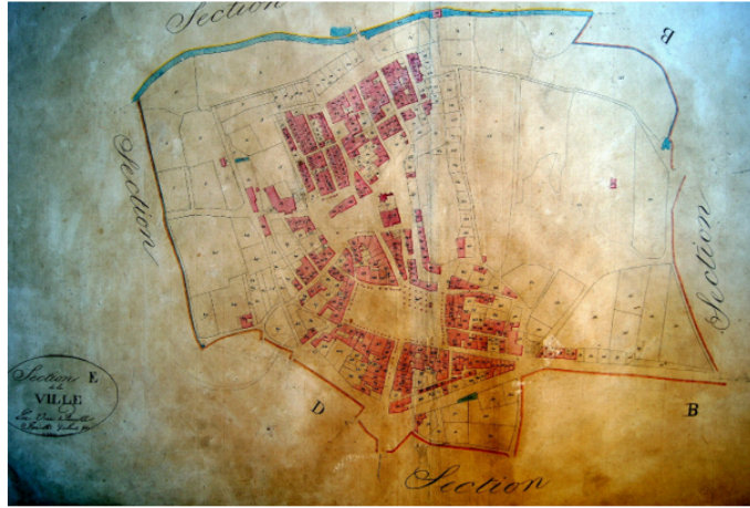
Mauvezin il y a 200 ans