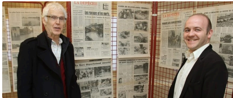
Les Gersois à l'Exposition universelle

Samedi 15 avril prochain, à 14h30, La Floureto recevra Laurent Marsol qui parlera du Gers et des Gersois dans les Expositions universelles de Paris de 1855 à 1900 :