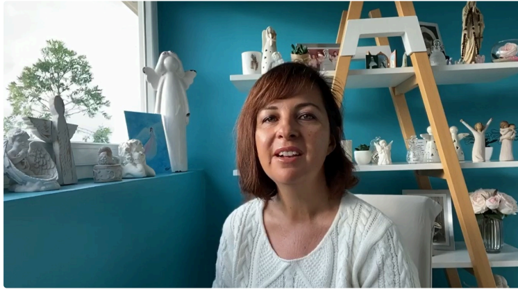
Et si la Mort n'existait pas ? Dimanche 23 avril, dernières places!