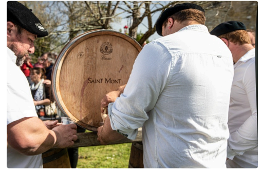
Mise en perce