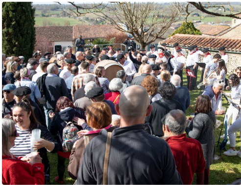
Le tonneau est assiégé