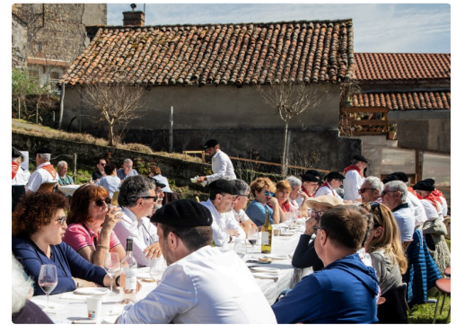
Une des nombreuses tables installées en plein air