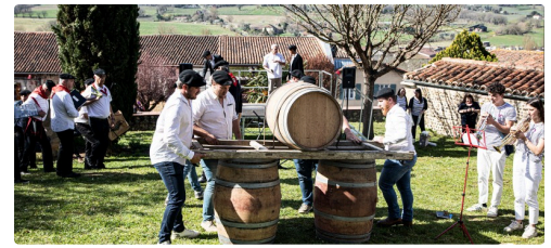
Arrivée du tonneau destiné à être mis en perce