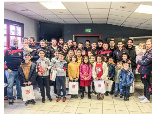
La grande famille des joueurs