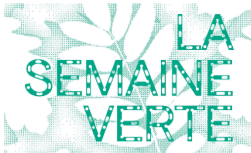
Semaine verte : Chemins de patrimoine agricole