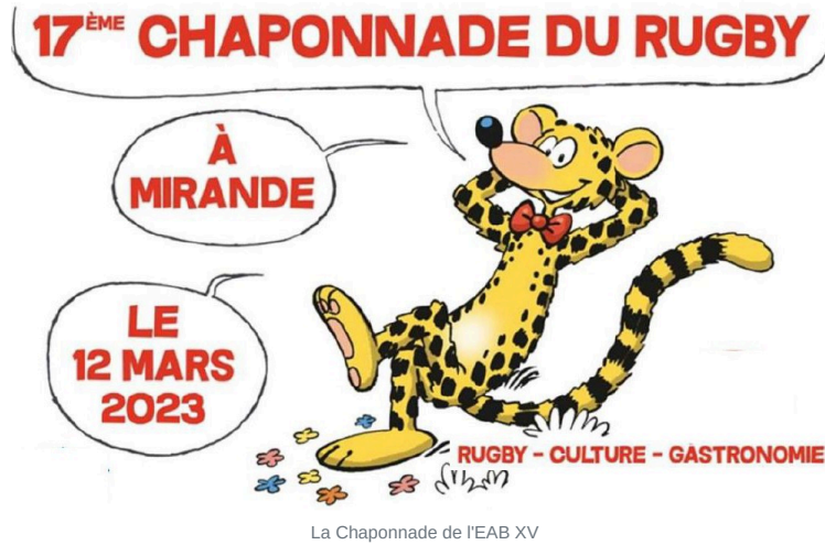
La Chaponnade de l'EAB XV

La fête du rugby, de la culture ,et de la gastronomie.