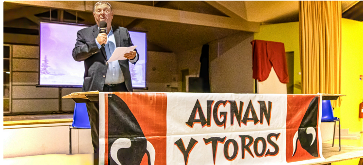
«Aignan y toros» présente ses 30èmes Pâques taurines en 2023