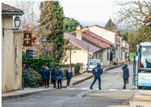
Visite du Musée d'Artagnan