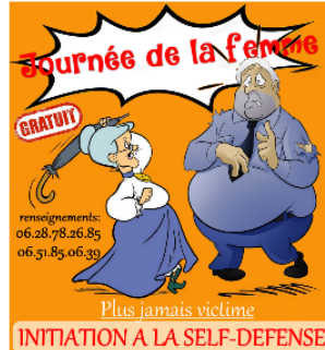
Journée de la femme : initiation à la self défense avec les Arts Martiaux Vicois

Les Arts Martiaux Vicois organisent une initiation gratuite à la self-défense dans le cadre de la journée internationale des droits de la femme qui a lieu le 8 mars