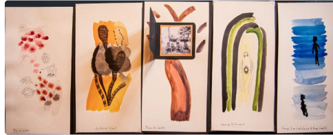
Aquarelles de Claudine Goux et poésie (© Tous droits réservés - 2022)