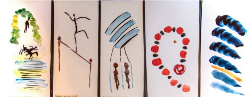
Aquarelles de Claudine Goux et poésie (© Tous droits réservés - 2022)