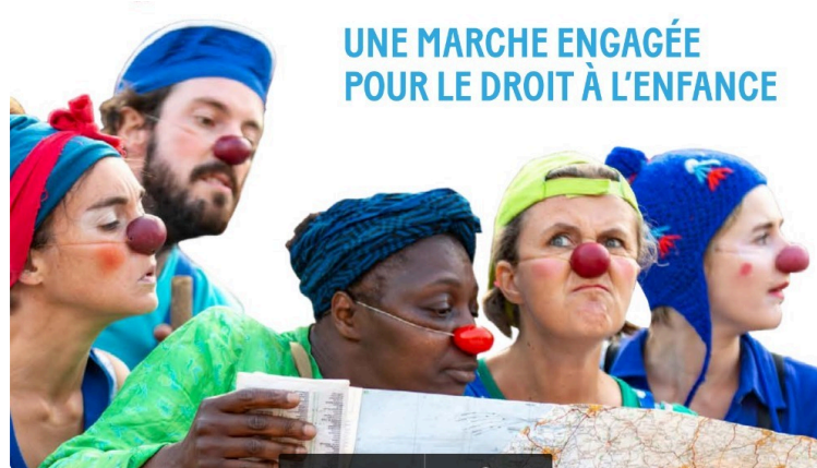
Le Gers , scène privilégiée par "LA MARCHÉ DES NEZ"