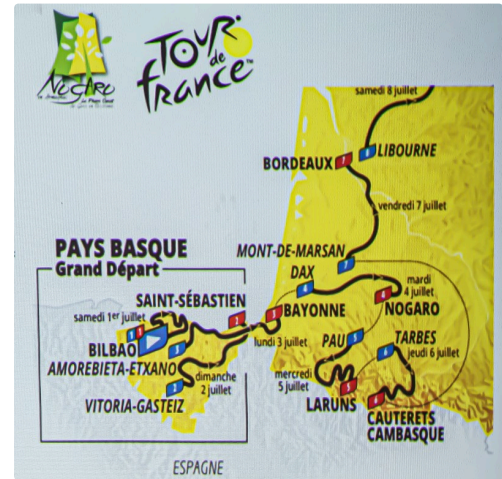
Carte du début du Tour jusqu'à Nogaro