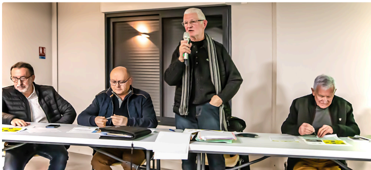
Le rêve du Tour de France devient réalité à Nogaro