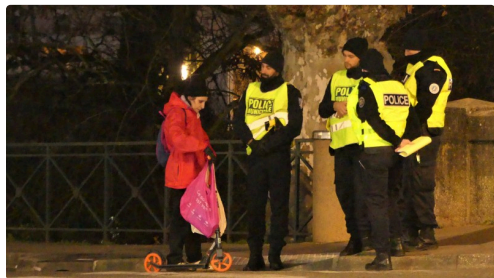
Encore de la bonne humeur.