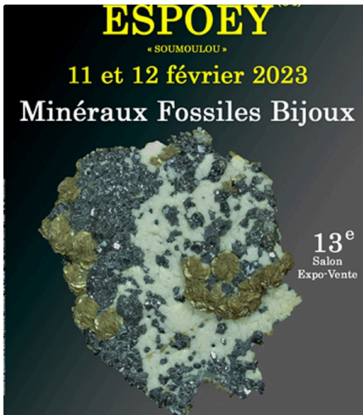
Salon des Minéraux Fossiles et Bijoux

Samedi 11 et dimanche 12 février, à la salle des fêtes d'Espoey situé à 8 km de la localité de Gardères (Hautes-Pyrénées), aura lieu la 13 e édition du salon des minéraux fossiles et bijoux .