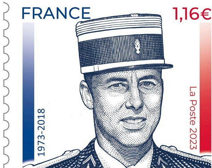
Un timbre à l'effigie du colonel Beltrame

La Gendarmerie nationale a dévoilé ce mardi un timbre postal en hommage au colonel Arnaud Beltrame, décédé en héros lors de la prise d'otage du Super U de Trèbes (Aude), le 23 mars 2018. Près de cinq ans après l'attentat de Trèbes, le souvenir d'Arnaud Beltrame est toujours présent et il sera désormais immortalisé sur un timbre. La création, réalisée l'artiste Sophie Beaujard, représente le colonel Beltrame en uniforme, sur un fond de drapeau tricolore. En ce qui concerne le timbre, il sera tiré à 705.000 exemplaires, en feuilles de 15 timbres, et sera commercialisé à compter du 27 mars prochain, soit quelques jours après la triste date de l'attaque terroriste. Ce timbre est imprimé en taille-douce (gravure en creux sur une plaque de métal). Il a une valeur faciale de 1,16 euro. Il a été imprimé par Philaposte, filiale de La Poste, dans son imprimerie de Boulazac (Dordogne).