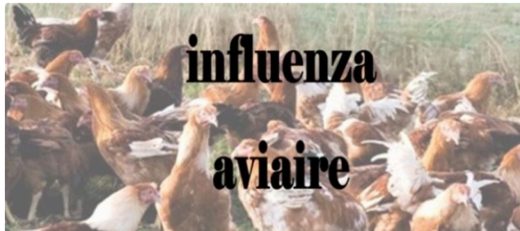
Influenza aviaire, un onzième foyer confirmé dans le Gers

Un nouveau foyer (le onzième dans le département) a été confirmé le 22 janvier par le Laboratoire National de Référence sur un élevage de la commune de AYZIEU et dépeuplé préventivement le 21 janvier. Par ailleurs une nouvelle suspicion est en cours aujourd'hui dans un élevage de poulets sur la commune de EAUZE. Le préfet du Gers a pris un arrêté redéfinissant, autour de cette suspicion une zone réglementée temporaire de 10 km bloquant les mouvements des oiseaux.