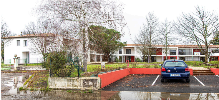
Le Journal du Gers visite le bâtiment de la CC Armagnac-Adour à Riscle

Des locaux spacieux, clairs et fonctionnels