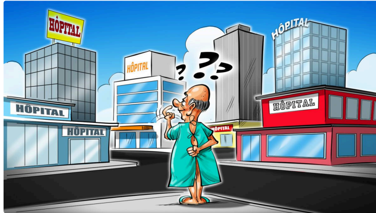
mais t'es où ? mais t'es pas là,

toujours le suspens pour l'hôpital d'Auch