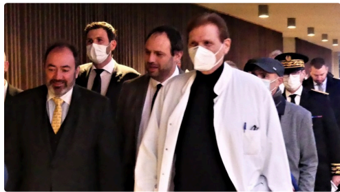
arrivée du ministre au pôle de la Reviscolada

" Un ambitieux projet hospitalier, qui bénéficie au total d'une dotation de soutien de l'Etat de 142 millions d'euros, et qui permettra de sécuriser et de conforter l'offre médico-chirurgicale dans l'ensemble du Gers. Il est évident que les deux projets [d'Auch et de la Reviscolada] vont de pair. Je dirais même plus : ils sont indissociables. Et leurs succès mutuels reposent sur leur complémentarité. Des fondations solides de coopération entre public et privée avaient déjà été établies entre le centre hospitalier d'Auch et la Clinique de Gascogne. La Reviscolada et l'hôpital se sont engagées non seulement à les poursuivre mais à les faire grandir." François Braun