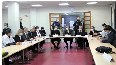
rencontre avec le personnel de l'hôpital