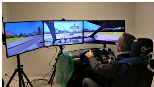
rééducation , la conduite