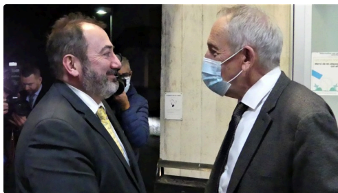
rencontre avec le maire d'Auch