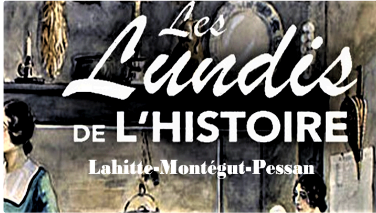
Ce soir : la mort de Raspoutine

Deuxième soirée consacrée à l'histoire russe : il sera question ce soir de la vie et de la mort de Raspoutine : son enfance, sa conversion à la religion, ses relations avec le tsar Nicolas II et Alexandra dont il guérit plusieurs fois leur fils Alexis, son influence sur la famille royale et la politique, l'aversion de Kototzov à son égard, sa mort complétée par le prince Youssoupov et rehaussée par des membres de la famille impériale.