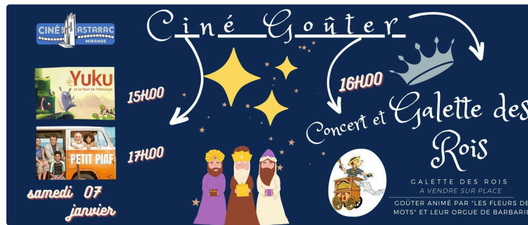
Concert et Galette des rois

De la guitare de Yuku la souris, en passant par l'orgue de barbarie de « Les fleurs de mots » jusqu'aux airs créoles et la voix délicieuse du " Petit Piaf", la nouvelle année se célèbre en musique au Ciné Astarac de Mirande.