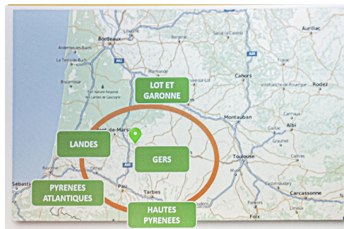
Territoire d'intervention du GE 4 Saisons (document projeté par Coralie Dauphinot)