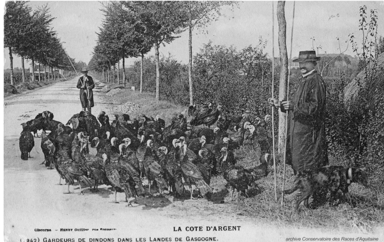
La poulhoio de nadau ou la dinde de Noël

Aujourd'hui encore, la dinde trône sur la table du réveillon ou du repas de Noël, la dinde fermière précise-t-on.