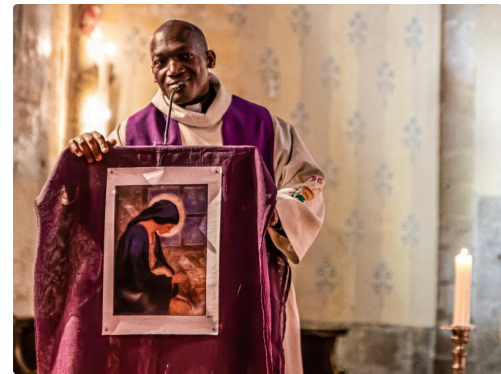
Le curé de Mirande, prêtre Pallotin, semble surpris que des militaires soient chrétiens...