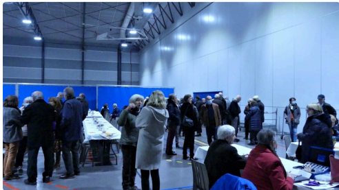
Pendant la "balance" de l'orchestre, on tchatche.