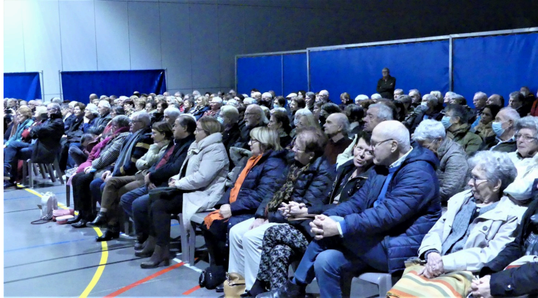
rendez-vous à l'automne 2023